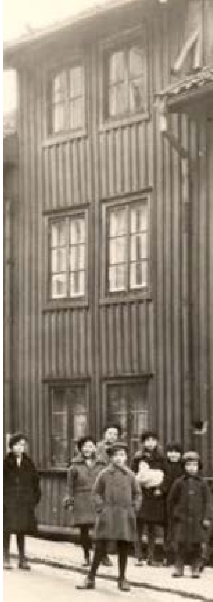
Bostadshus vid Landalatorget i Göteborg år 1930.

Avsluta arbetet med att projicera den gemensamma kartan synligt i klassrummet.