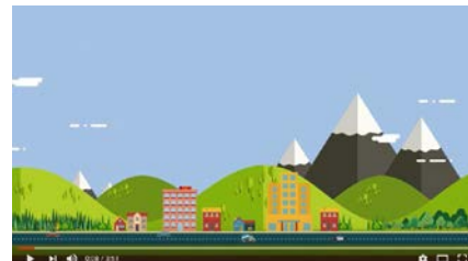
Från planering till byggande